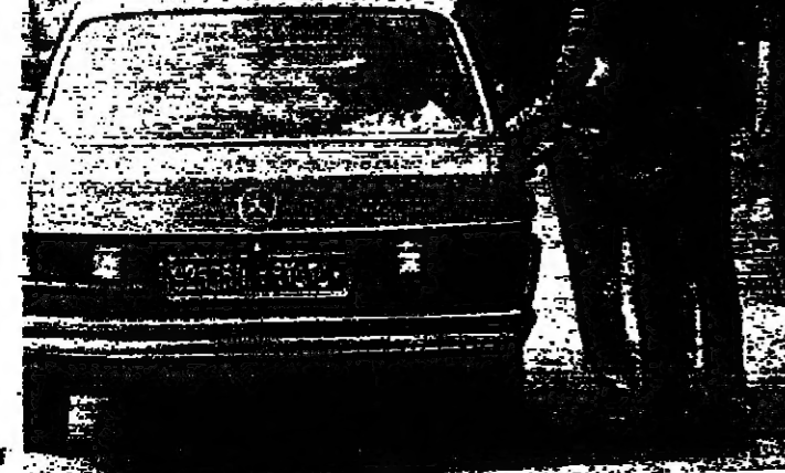
صغيرة خزان سيارة قرب جنبه الاوتوباص